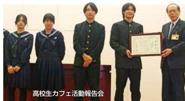
高校生カフェ活動報告会