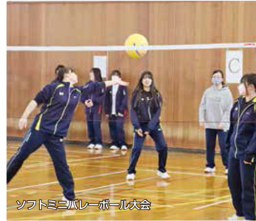
ソフトミニバレーボール大会