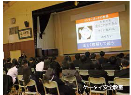
ケータイ安全教室