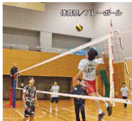
体育祭/バレーボール

生徒同士は他学年とも仲が良く、学年の壁を越え充実した高校生活を送ることができます。高校生活という、かけがえのない貴重な時間を、そして最高の青春時代を、芦別高校で過ごしてみませんか？