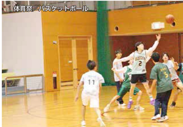
体育祭/バスケットボール